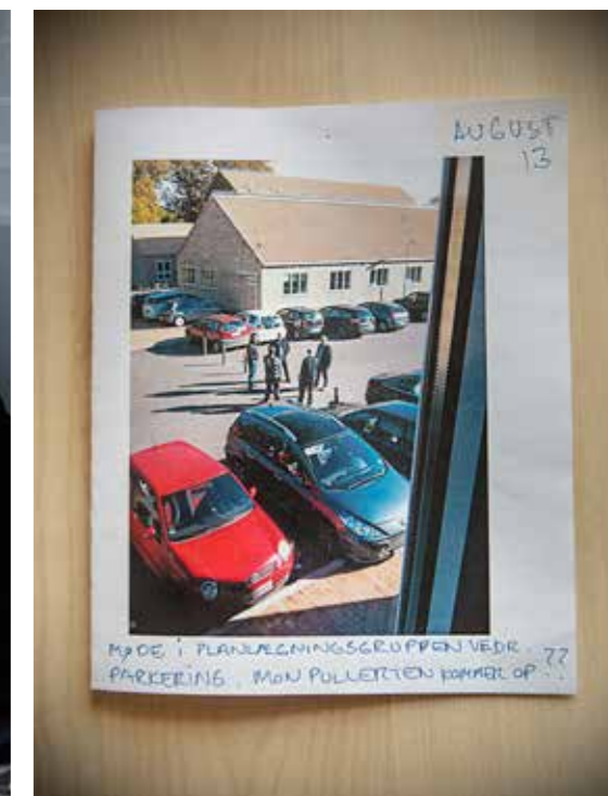
Medarbejderne på Institut for Folkesundhed har fulgt med i foljetonen omkring parkeringsanlægget – og deler deres iagttagelser med kollegerne.

forbi.« men pludselig kunne jeg høre pillen ridse bilens ene side.«